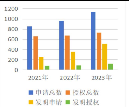
图表4 近三年专利增长态势图